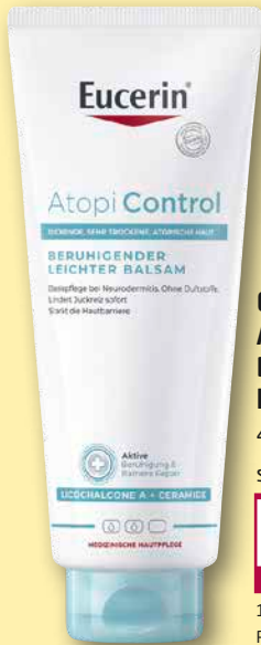
Eucerin ® AtopiControl Beruhigender leichter Balsam 400 ml