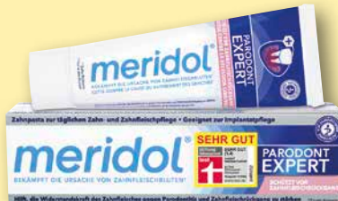
meridol ® Zahnpaste Parodont-Expert 75 ml