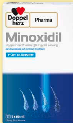
Doppelherz Pharma Minoxidil Für Männer

50 mg/ml Lösung zur Anwendung auf der Kopfhaut 3 x 60 ml