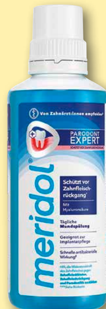
meridol ® Parodont-Expert Mundspülung 400 ml