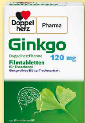
Doppelherz ® Pharma Ginkgo 120 mg 120 Filmtabletten