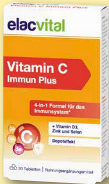
elacvital Vitamin C Immun Plus 30 Stück