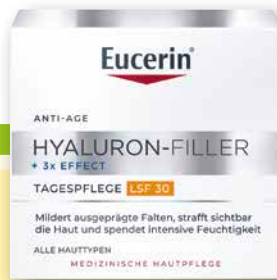
Eucerin ® Anti-Age Hyaluron-Filler Tag LSF 30, 50 ml