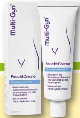
Multi-Gyn ® FeuchtCreme 25 g