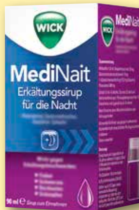
Wick MediNait Erkältungssirup für die Nacht