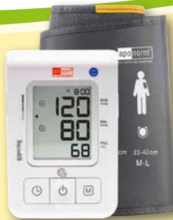
aponorm ® Blutdruckmessgerät Basis Control Oberarm