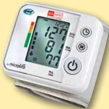
aponorm ® Mobil Basis

Achten Sie auf weitere Angebote in unserer Apotheke!