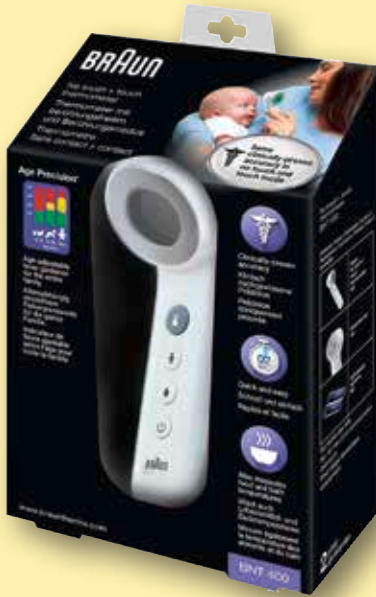
Braun Berührungsfrei Stirnthermometer